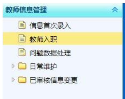
图 1. 新教师入职建档