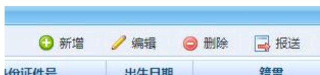
图 4. 依次点击“新增”和“报送”